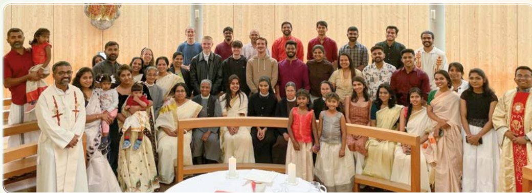
TEXT UND FOTO BELKEY JOSEPH

Glaube, Zusammenhalt und ein Stück Heimat in der Ferne