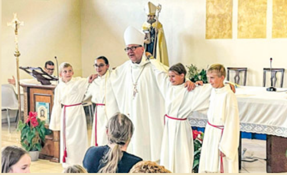
Gottesdienst mit Bischof Hermann

*Bericht über die Ministrantenwallfahrt des Seelsorgeraums Mieming nach Rom 2024*