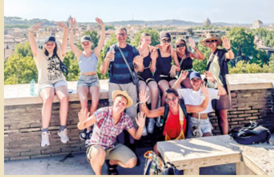
Die Pilgergruppe am Aventin