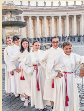
Unsere Minis am Petersplatz