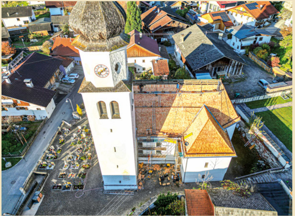
Kirche von oben