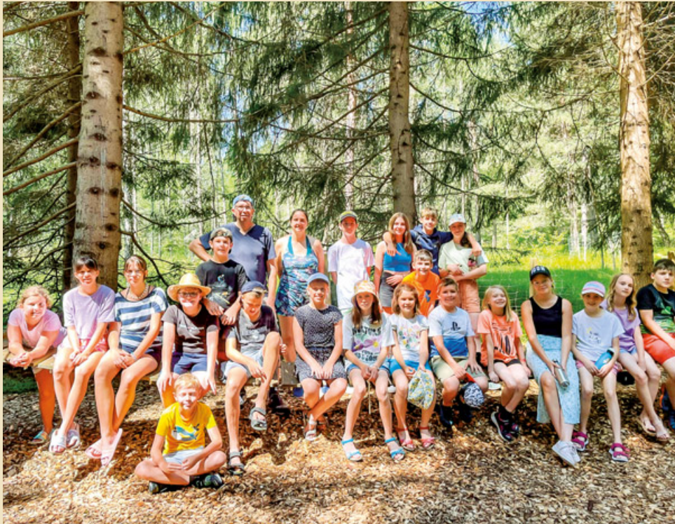
Teilnehmer der Minitage