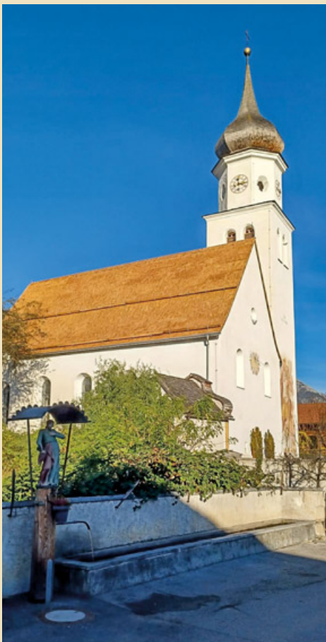
Gesamte Westseite fertig gedeckt