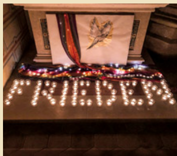
Motiv Frieden – Chor Chorona