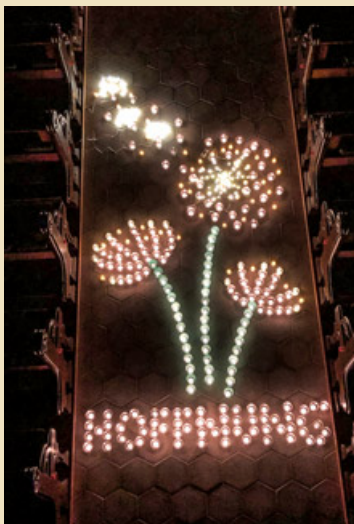
Motiv Hoffnung – Bäuerinnen Mieming