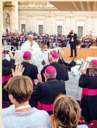
Beim Papstbesuch am Petersplatz