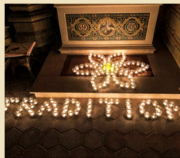
Motiv Tradition – Trachtenverein Edelweiss