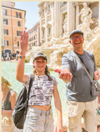
Münzenwerfen am Trevibrunnen