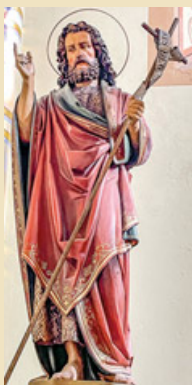
Johannes der Täufer ist für uns der adventliche Wegbereiter für Christus.

Johannes' Geburt mit Mutter Elisabeth und Vater Zacharias ein halbes Jahr vor der Geburt Jesu verwunderten alle Leute – heißt es im Lukasevangelium – und führten zu der Frage „Was wird wohl aus diesem Kind werden? Denn es war deutlich, dass die Hand des Herrn mit ihm war.“