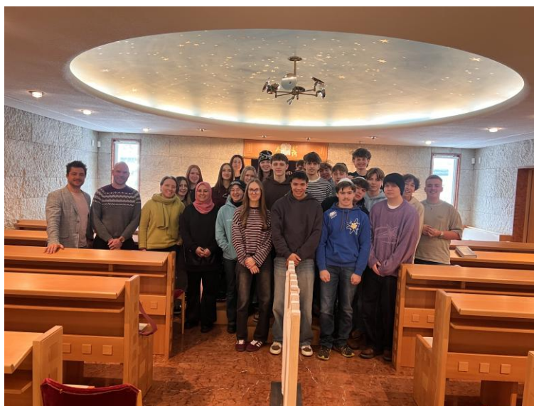
Besuch der Synagoge in Innsbruck

Eine Einladung zum Dialog ist auch die nächste Openreli-Online-Fortbildung mit dem Titel „feier.werk“. Einen Monat lang halten renommierte Referent:innen Impulsvorträge und Podiumsdiskussionen rund um die Grundlagen des interreligiösen Dialogs, kooperative Formen des Religionsunterrichts und Perspektiven für die Gestaltung von Feiern an der Schule angesichts religiöser Pluralität. Wer möchte, nutzt die Gelegenheit, im dialogischen Austausch eine konkrete Abschluss- oder Schulanfangsfeier für die eigene Schule zu planen. See you bei Openreli 2026!