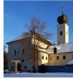
St. Anna Reutte