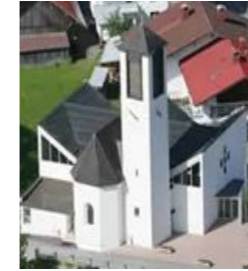
Hl. Geist Lechaschau