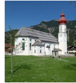
St. Martin Wängle