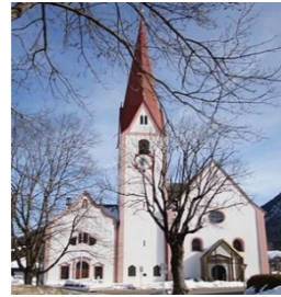
Hl. Peter u. Paul Breitenwang