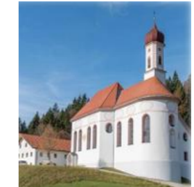
St. Ulrich Pinswang