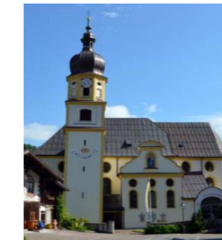
Mariä Himmelfahrt Vils