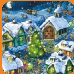
Türchen auf, Freude rein!