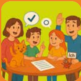
kleine Stimmen – große Wirkung