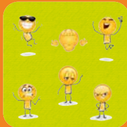
Umgang mit Handy & Co