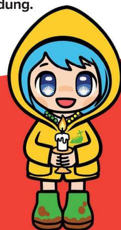
Luce, das Maskottchen des Hl. Jahres 2025