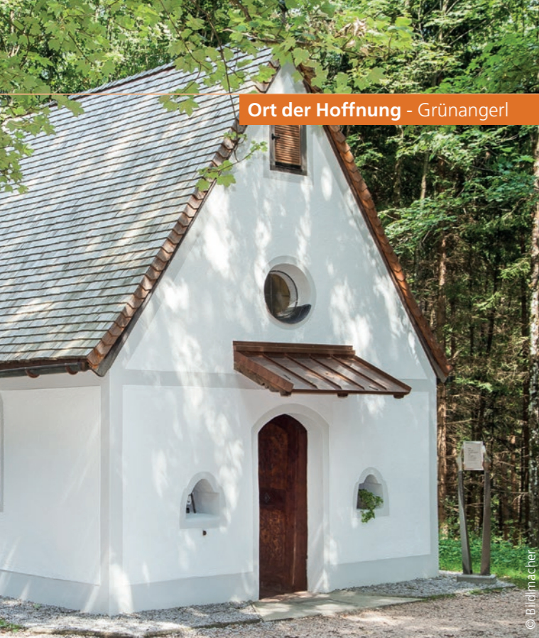
Ort der Hoffnung - Grünangerl