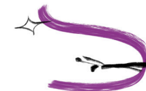
In der Spur des Herzens 1. Woche, dibk.at/exerziten