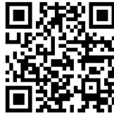
QR Code 2

Lass deinen Mund stille sein (Hagios II, CD Gesänge zur Andacht und Meditation von Helge Burggrabe und Christof Fankhauser) siehe QR Code 2