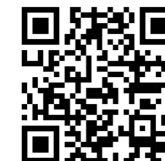
QR Code 2