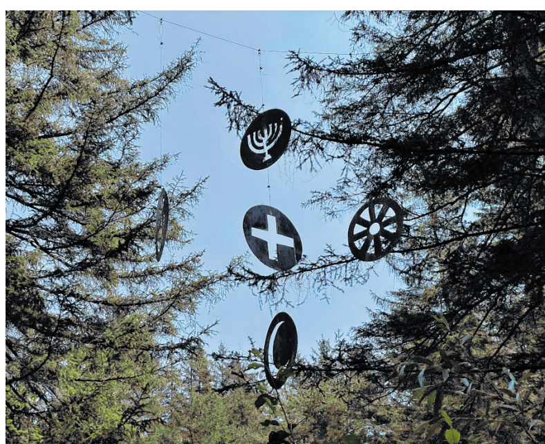
Spirituelle Impulse und künstlerische Installationen in der Natur: Eine Station am Besinnungsweg in Gnadewald.