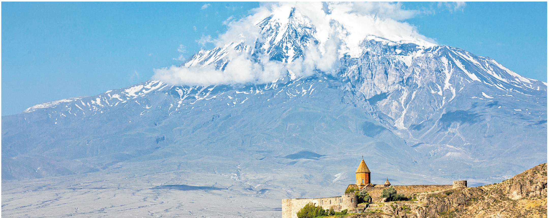
Ein biblisches Gebirge: Am Ararat soll Noah mit seiner Arche gestrandet sein. Das Kloster Chor Wirap steht seit dem 17. Jahrhundert in Sichtweite des Berges, schon tausend Jahre davor wurde eine Kapelle an dem Ort errichtet.