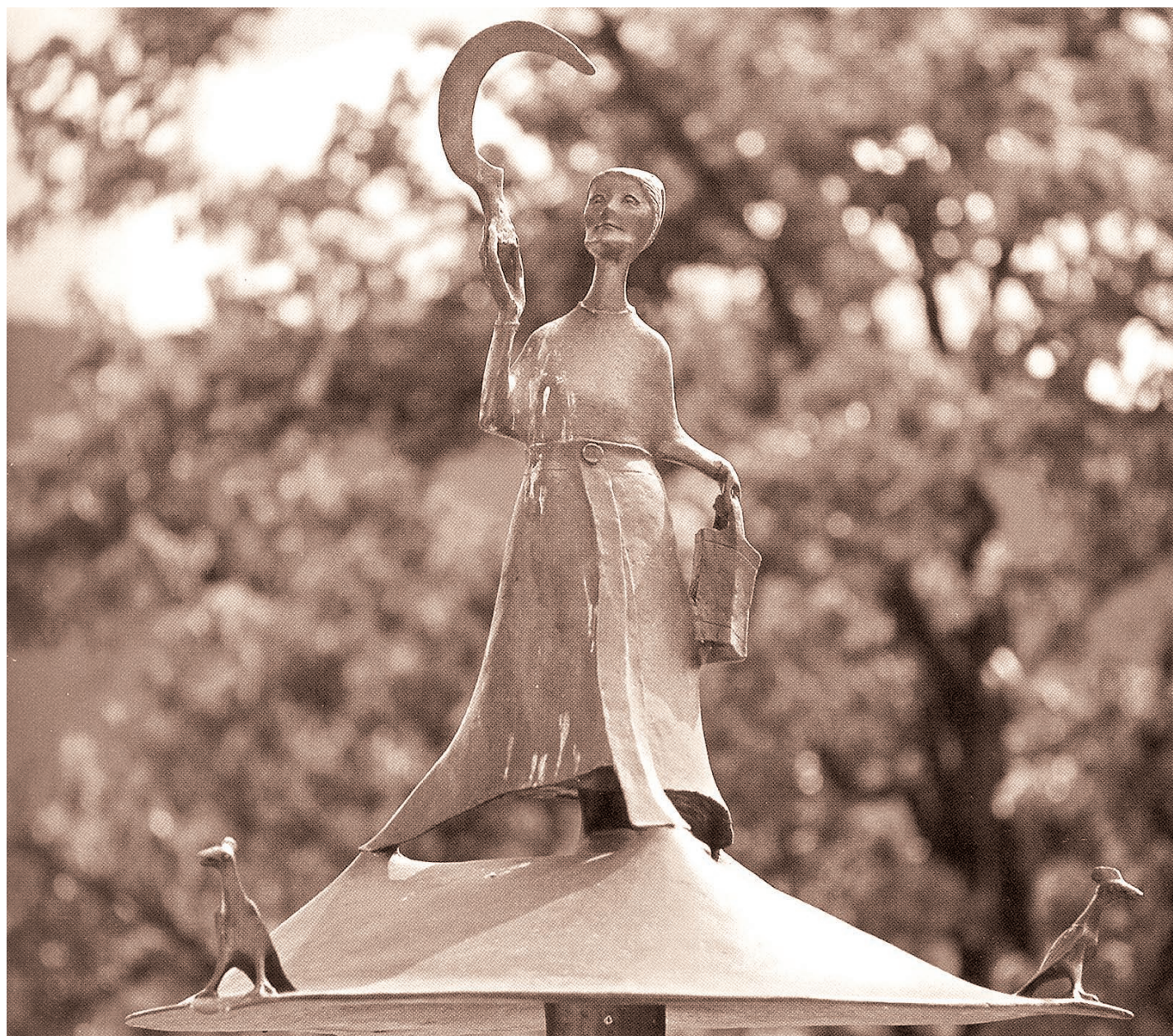
Der Notburgabrunnen im Freigelände des Volkskundemuseums in Dietenheim bei Bruneck, gestaltet vom Künstler Martin Rainer aus Schnals.

Deshalb ist der Sonntag den Christen heilig. Er ist nicht irgendein freier Tag, den man nach Belieben in der Woche herumschieben kann. Er steht am Anfang, vor allen anderen Tagen. Er