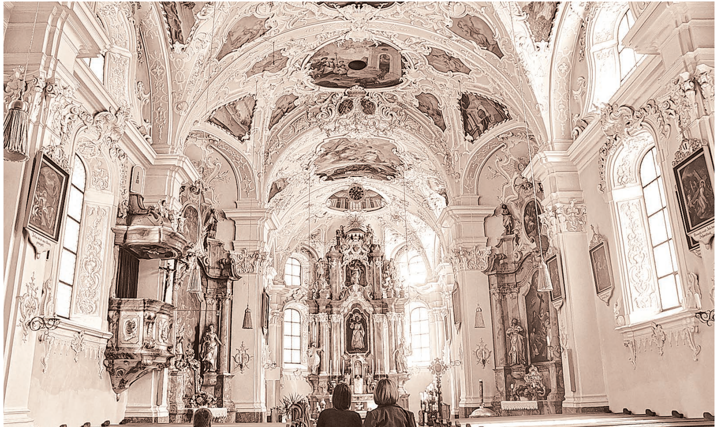
Blick in die Notburgakirche in Eben am Achensee.

Anschrift für alle: Brunecker Straße 3, 6020 Innsbruck, Postfach 578, Tel. 0 512/53 54-0, Fax 0 512/53 54-3577. moment@dibk.at