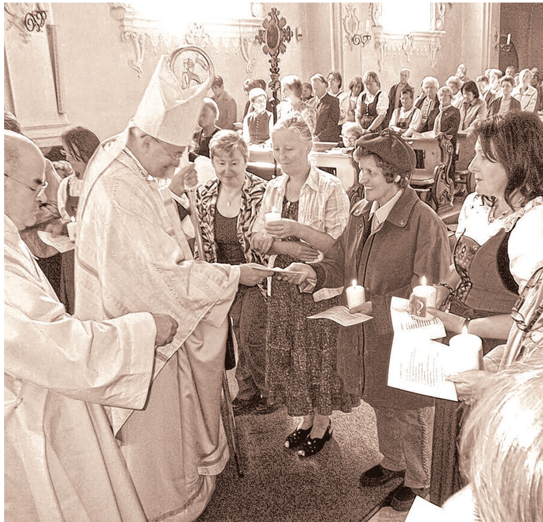
Seit dem Jahr 2000 entschließen sich alljährlich Frauen, der Notburga-Gemeinschaft beizutreten. Im Bild die Aufnahmefeier mit Erzbischof Alois Kothgasser im September 2011 in der Notburgakirche in Eben am Achensee.

Und die gibt es: Ausgehend von Eben am Achensee, wo die hl. Notburga ihre letzte Ruhe fand, haben sich zahlreiche Frauen zu Notburga-Gemeinschaften zusammengefunden. Neben der Diözese Innsbruck sind diese auch in der Erzdiözese Salzburg, im Erzbistum München-Freising, im Bis-