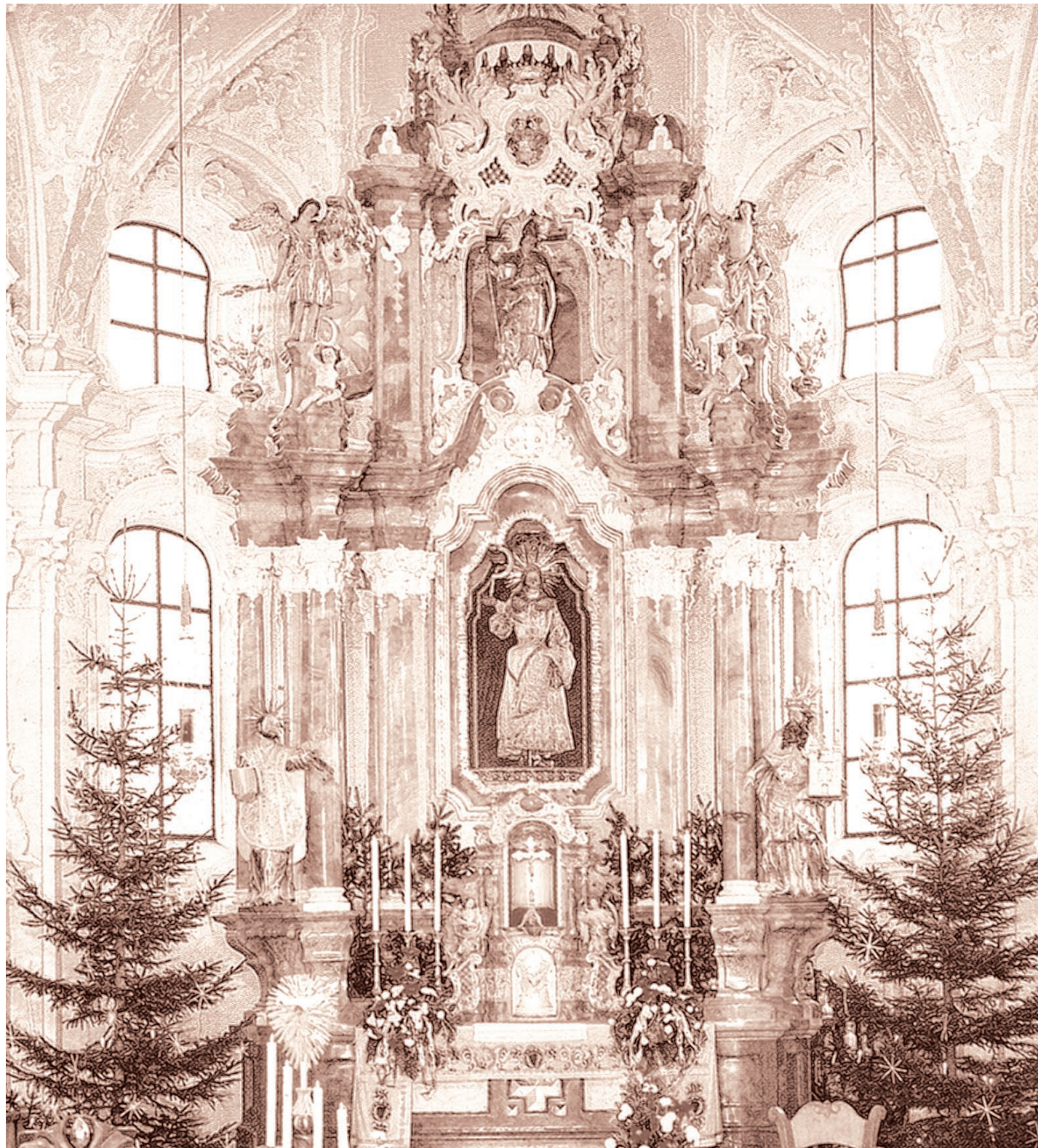
Die Gebeine der heiligen Notburga – in kostbarem Gewand gefasst – befinden sich im Hochaltar der Kirche in Eben am Achensee.

Notburga ist bis heute für viele Gläubige eine ausgesprochen sympathische Heilige. In ihrer Lebensge-