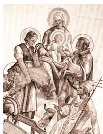
Darstellung der Notburga mit der Krippe.

Das Organisationskomitee des Gedenkjahres hat alle Pfarren in Tirol und Südtirol eingeladen, im Gedenkjahr die Notburga-Kirche in Eben am Achensee als Ziel einer Pfarrwallfahrt zu wählen. Empfohlen wird, die Wallfahrten inhaltlich am Gedenkjahr-Motto