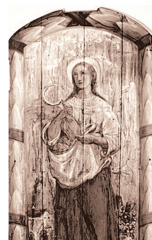
... aus dem ...