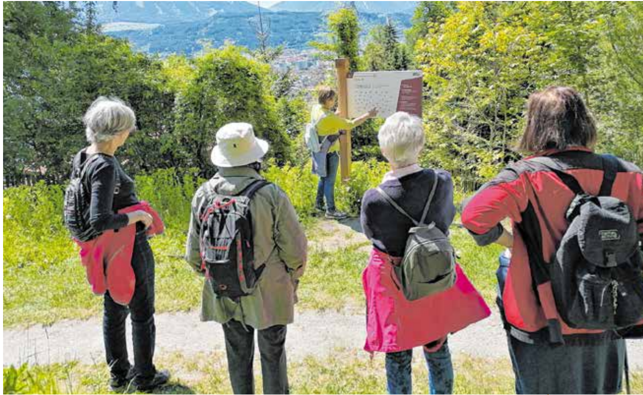
Die Patscher SelbA-Gruppe wird mit Sonnenschein am DenkSportWeg belohnt.

Der Innsbrucker DenkSportWeg ist nur der erste von mehreren, die in ganz Tirol entstehen werden. Schon jetzt nutzen ihn