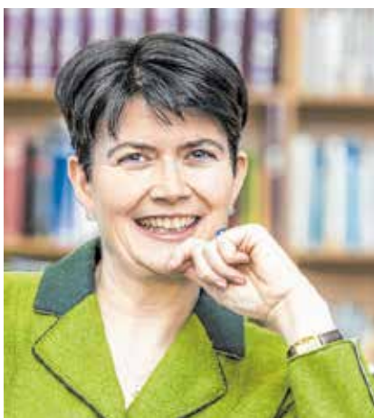
„Kopfsalat mit Herz – Eine spirituelle Entdeckungsreise durch den Garten“ von Elisabeth Rathgeb ist im Tyrolia-Verlag erschienen.