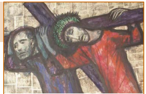
Einer trage des anderen Last