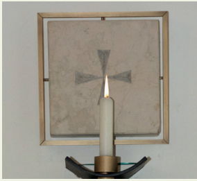
Neues Apostelkreuz „Maria Magdalena“ in der Pfarrkirche Allerheiligen © Gernot Schwendinger