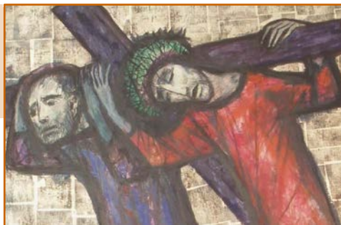
Einer trage des anderen Last