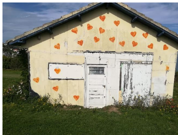
Aufgenommen letzten Sommer in der Normandie, wo ich auch heuer wieder "den Wind gspiarn" werde