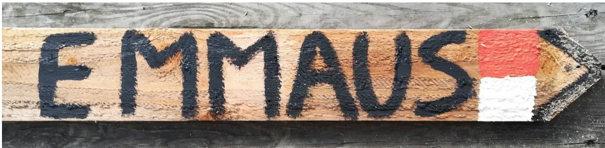
Von Schüler:innen der WFO TFO Brixen gestaltetes Wegschild für den Schluss-Gottesdienst 2023

Trotz all der genannten Herausforderungen, fragend ein Stück des Wegs mitzugehen, kann eine mögliche Haltung in der Begegnung mit den uns anvertrauten, religiös suchenden Jugendlichen sein. Mit einem Wort: Emmaus.