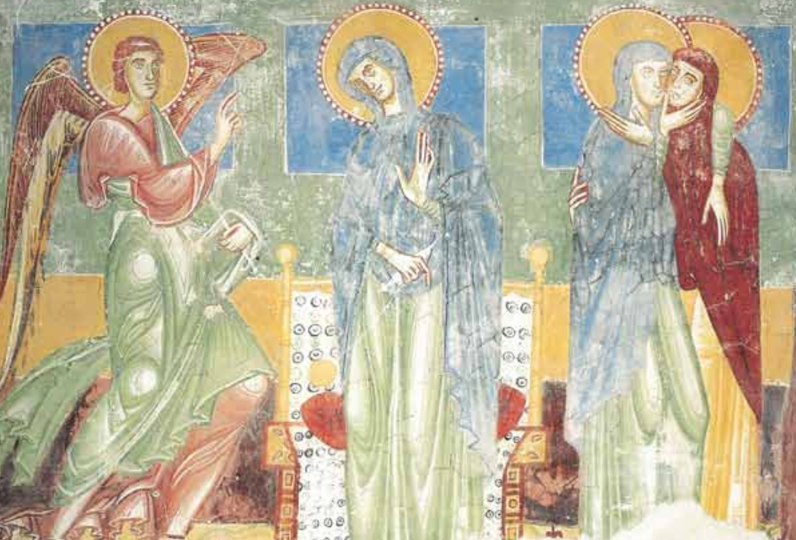
Fresko „Verkündigung und Heimsuchung“ an der Südwand der Burgkapelle Hocheppan/Südtirol (um 1200)